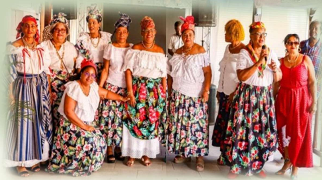
Les membres d'ACF en titane

culture, jeunesse, transmission, responsabilité sociétale, les quatre piliers du projet ACF.